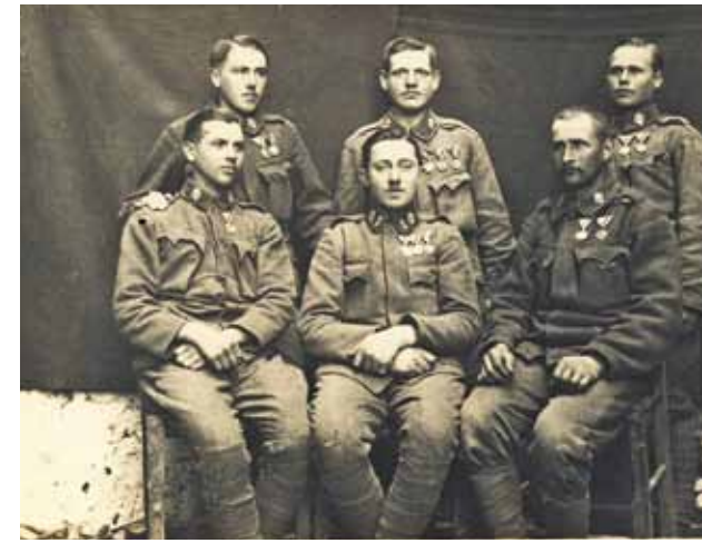
Links hinten: Vater im ersten Weltkrieg, gestorben 1938