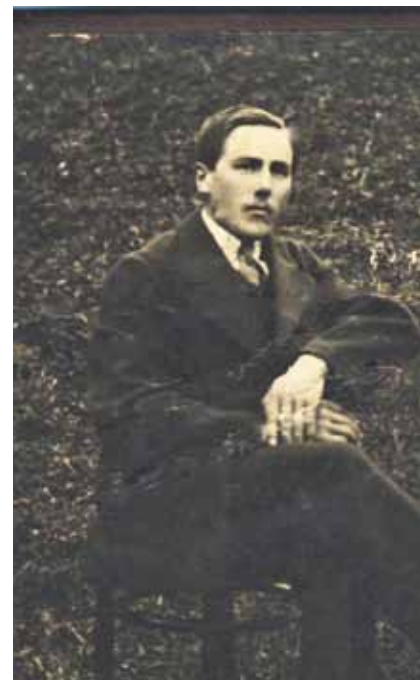
Vater vor der Einberufung