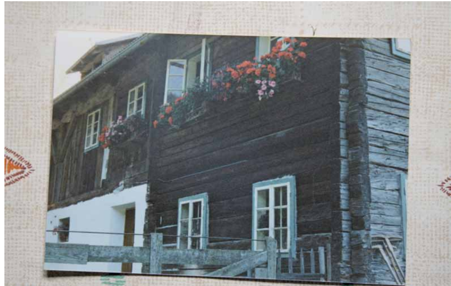
Das Haus 1940